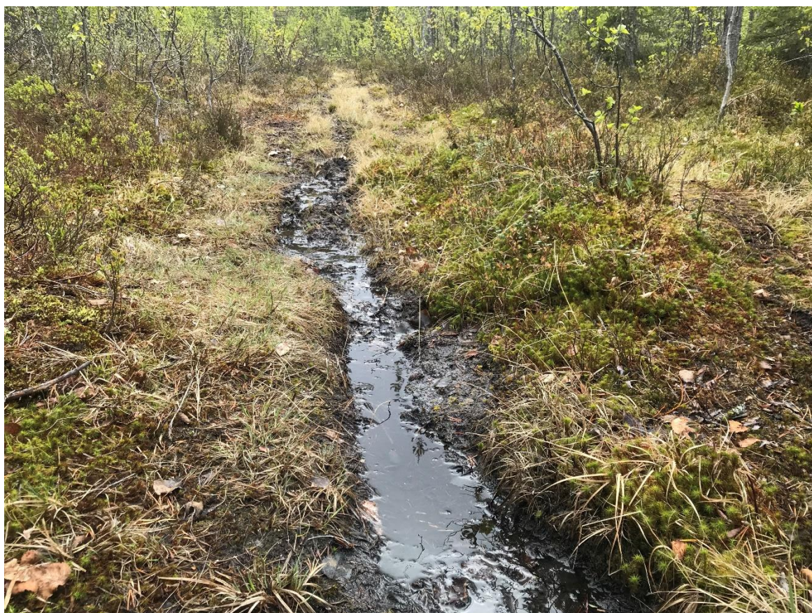
Figur 4 Detta ska föreställa en skogscykelstig. Infrastrukturen i naturen är på många ställen undermålig. Med rätt åtgärder skulle besöksmålet och aktiviteten bli mer tillgänglig och generera en helt annan upplevelse för besökaren, samt bespara naturen onödigt slitage.

Besöksnäringens utmaningar i nuläget är framför allt bristande turistisk och digital infrastruktur, tillgång till transporter och kommunikation, kompetens i nationell och internationell marknadsföring, möjligheter till samverkan inom branschen samt att det finns för få entreprenörer med året runt verksamhet som också är exportmogna.