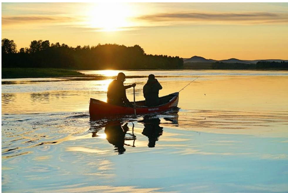
Figur 2 Att få uppleva midnattssolen är något speciellt och en av många spektakulära naturtillgångar som finns i kommunen.