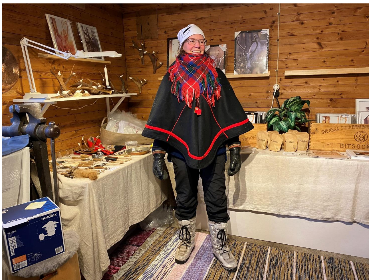
Figur 1 | Överkalix finns flertalet drivna entreprenörer som erbjuder besökaren genuina och eftertraktade upplevelser.

Det råder en diffus gränsdragning mellan natur och kultur, eftersom de är nära sammankopplade och påverkar både varandra och besökarnas naturupplevelse. Eftersom konsumtion av kultur tillsammans med naturupplevelser genererar ekonomiska intäkter på landsbygden är kultur ett viktigt komplement till natur.