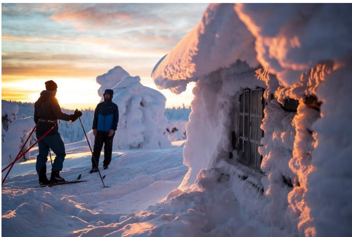
Figur 5 Lapland Arctic Ultra är ett långt vinterlopp som har stor potential att sätta Överkalix på kartan som vinterdestination.

Evenemang: Definieras som en större tillställning som arrangeras under en kortvarig period, det vill säga utanför din löpande verksamhet. Exempel på evenemang är större marknader och fisketävlingar, konserter och festivaler som genererar inresande besökare och utgör vanligtvis en reseanledning.