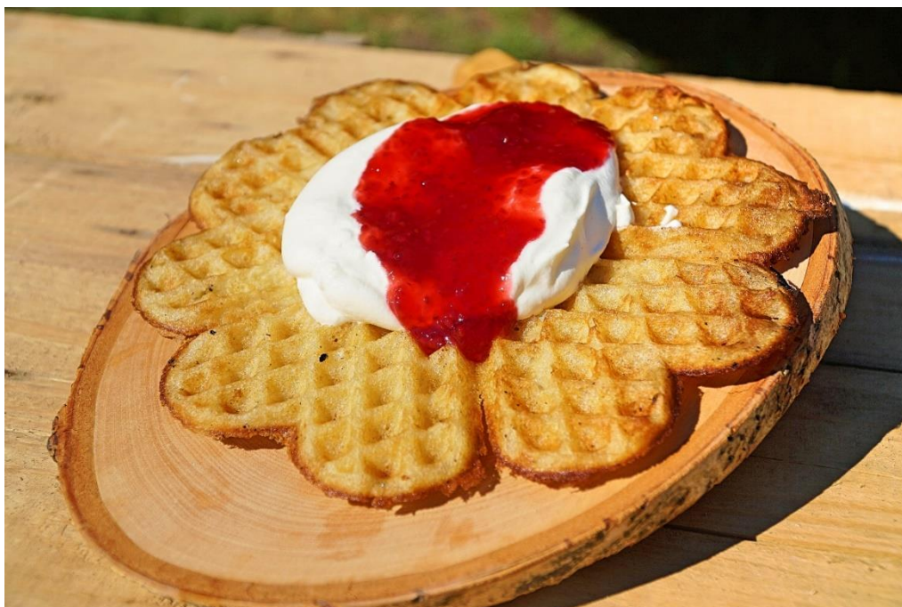
Figur 6 Ett gott värdskap stärker servicearbetet och ökar besöksmåls attraktivitet, samt ökar sannolikheten för att turister kommer åter till kommunen.

Efterfrågan på en gemensam utbildning inom service och värdskap finns hos besöksnäringföretagarna. Ett gott värdskap stärker servicearbetet och ökar besöksmåls attraktivitet, samt ökar sannolikheten för att turister kommer åter till kommunen. Utbildningen ska också bidra till att öka kännedomen bland besöksnäringen om vilka besöksmål, aktiviteter och företagare som finns inom kommunen, för att på så sätt kunna rekommendera varandra och bistå turisterna med god service för att göra vistelsen än mer innehålls- och upplevelserik. Swedish Lapland har år 2018 genomfört en värdskaputbildning med hjälp av "Värdskap Sverige", vilken var väldigt passande för besöksnäringen i regionen. Målet är att besöksnäringen och alla som på något sätt kommer i kontakt med turister ska genomgå en service- och värdskaputbildning som ska vara attraktiv, enkel att erbjuda och finnas lättillgänglig både för nyetablerade företagare och de mer etablerade företagare som inte har genomgått utbildningen. Ett utbildningskoncept med så kallade "värdsaps-coacher" kan vara ett bra sätt för att bygga upp en hållbar och lättillgänglig värdsapskompetens för besöksnäringen i kommunen.