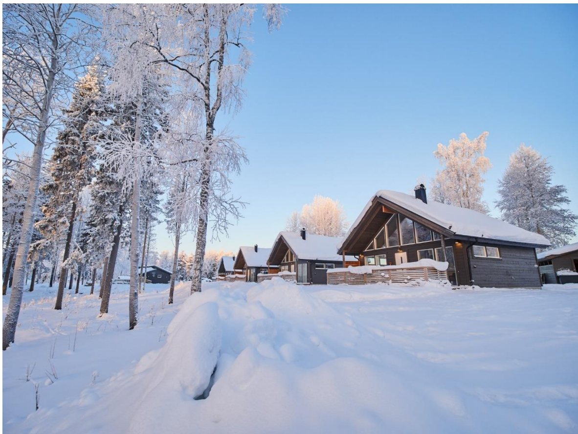
Figur 3 År 2019 uppgick den totala turismomsättningen till 68 miljoner kronor och innebar 39 årssysselsatta, främst inom restaurang och logi.